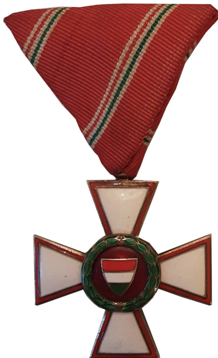
A kitüntetés előlapja