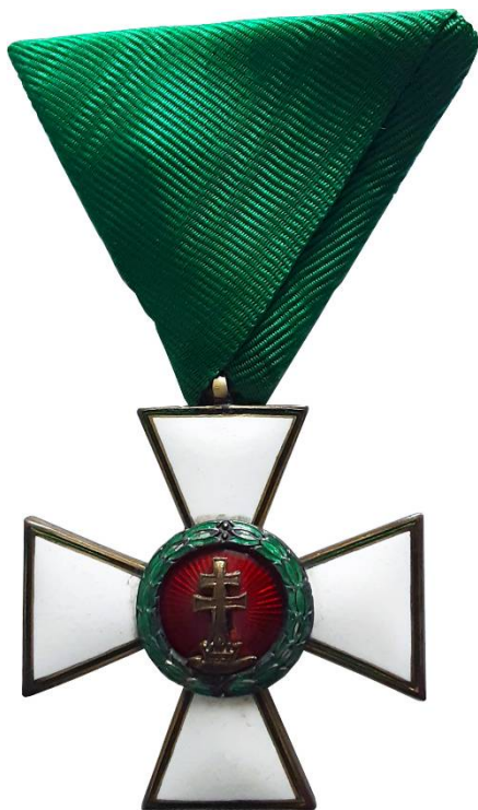
A kitüntetés előlapja