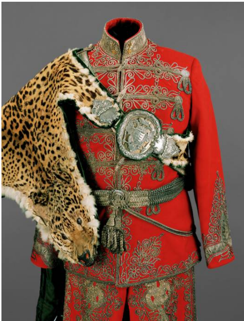
A Magyar Királyi Nemesi Testőrség egyenruhája